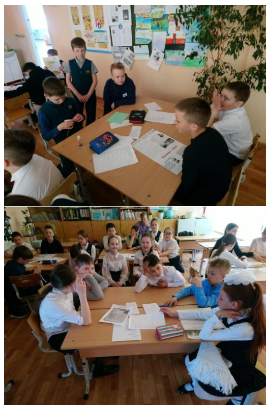
Урок родной литературы (русской) в 4 «А» классе по теме: «Моя Родина-Россия».

Целевые показатели участия участников образовательных отношений, вовлеченных в Фестиваль открытых уроков представлены в таблице